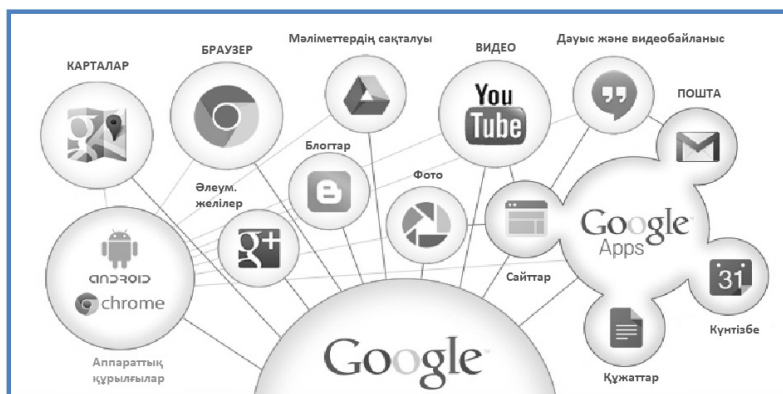
1-сурет. Google Apps for Education